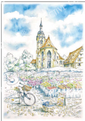
「ホリデーマーケット」